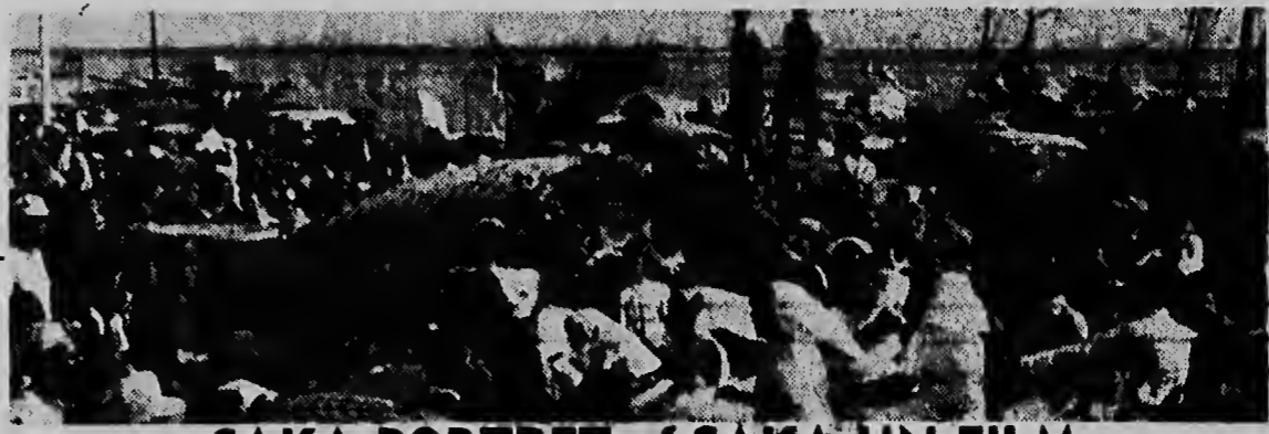
SAKA PORTRET of SAKA UN FILM